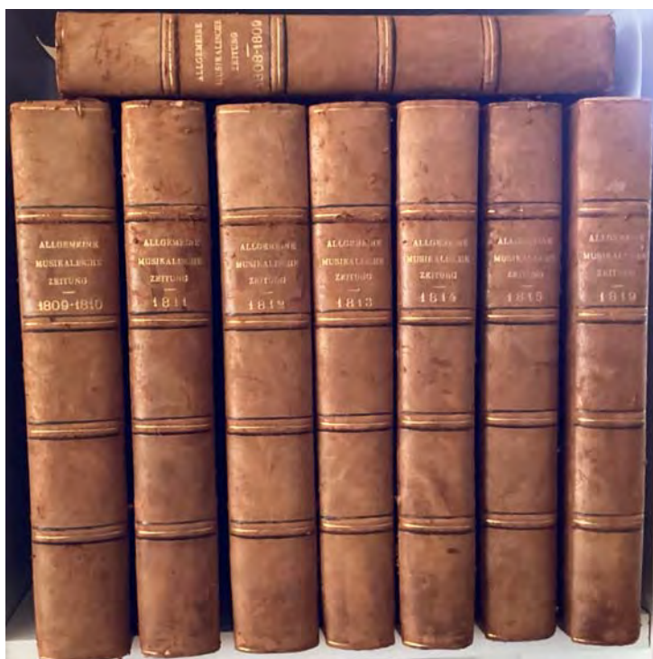
Nr. 11 E. T. A. Hoffmann, 34 Erstdrucke und Rezensionen in der "Allgemeinen Musikalischen Zeitung"